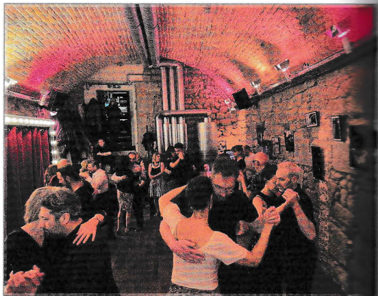
Late Night im ‚La Perla‘ - El Salón bei Camille & Valentino (Sorpresi Tango)